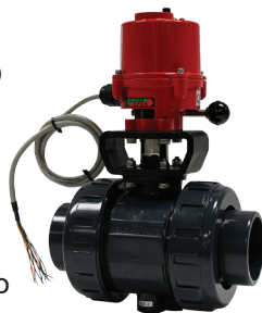
Válvula de bola Tipo 21